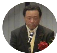
— 山口区議会議長 —