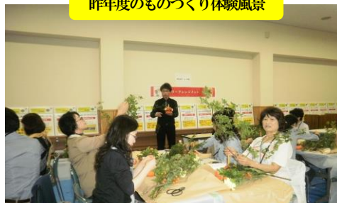
昨年度のものづくり体験風景