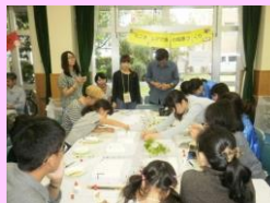
ミニチュアで街の風景づくり