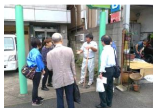
【事業所見学の様子】