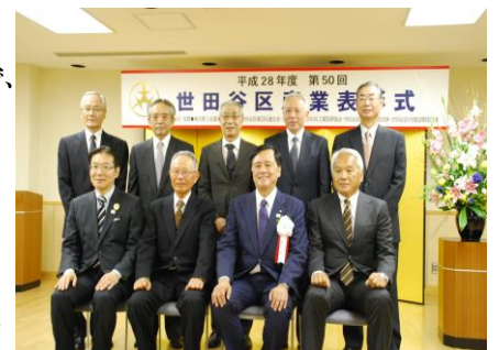
【保坂区長と受賞されたソーラーJPTの皆様】