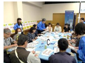
【手作り防災グッズの作成】