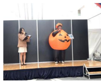
【人気者の丸山理事】