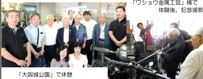
「ワショウ金属工芸」様で 体験後、記念撮影

その後、同じ東大阪市の「ものづくりビジネスセンター大 阪」様では、ものづくり企業の優れた技術や製品の実物など が 200 ブース、展示されていました。改めて日本のものづく りのパワーを再認識し、新たな意欲を感じさせられた視察研 修となりました。ご協力をいただきました皆様には大変お世 話になりました。