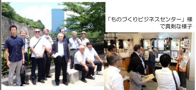
「ものづくりビジネスセンター」様 で真剣な様子