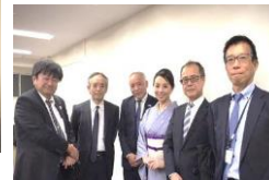
(島田さんを囲んで)