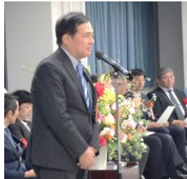
(保坂区長よりご祝辞)