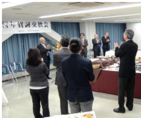
(森副会長閉会挨拶)