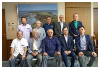
宮古島市長(前列中央)と記念撮影