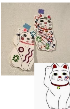
豪徳寺のまねきね